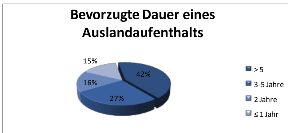
Abb.1: Schweizer Arbeitnehmer gehen bevorzugt für längere Zeit ins Ausland

Die Resultate der weltweit einzigartigen Studie erstaunen: Ganze 37 Prozent der Befragten Schweizer Arbeitnehmer wären jederzeit bereit für ihren Beruf ins Ausland zu ziehen. 29 Prozent könnten sich einen beruflichen Auslandsaufenthalt zumindest vorstellen. Dabei sind 42 Prozent bereit, für mehr als 5 Jahre im Ausland zu arbeiten. Als Hauptbeweggrund wurde die Erweiterung der beruflichen Erfahrung genannt (60 Prozent). Aber auch der Reiz, sich einer neuen Herausforderung zu stellen (43 Prozent) und andere Länder und Sitten kennenzulernen (42 Prozent) sind wichtige Beweggründe. 56 Prozent erklären sich bereit, auch innerhalb der Schweiz einen beruflichen Standortwechsel vorzunehmen.